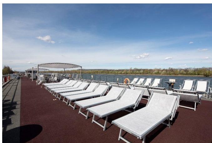
MS Nestroy, Sonnendeck