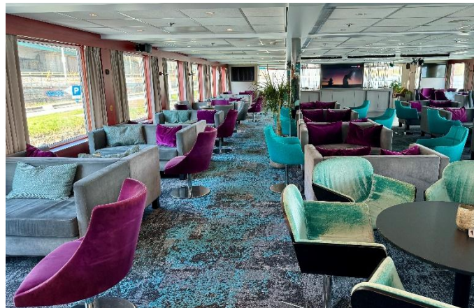
MS Nestroy, Barbereich

Schon am frühen Morgen erreicht das Schiff Linz. Nach dem Frühstück an Bord sagen wir schließlich der MS Nestroy Lebewohl.