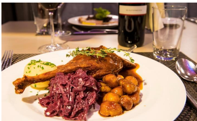
Martini-Gansl Essen (Symbolbild)

Für die Kreuzfahrt muss ein gültiges Reisedokument wie Reisepass oder Personalausweis mitgeführt werden.