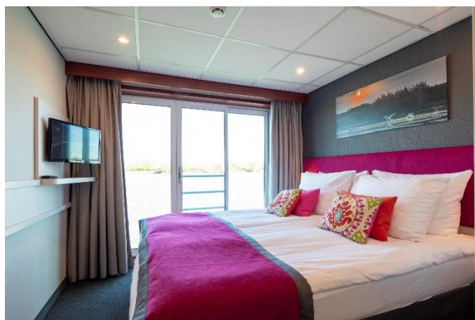
MS Nestroy, Doppelkabine Schiller- bzw Goethedeck