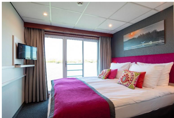
MS Nestroy, Doppelkabine Schiller- bzw Goethedeck

*Kat. E & F: keine Einzelbelegung möglich